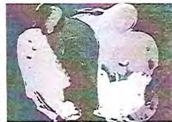
feita cun lu qu'i contóu Maizón, que tovu pul mundu ya nun truxu muito. Nun hay qu'equivocase, la suerte nun ya pa todus...